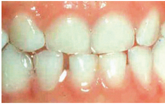
Dientes sin caries