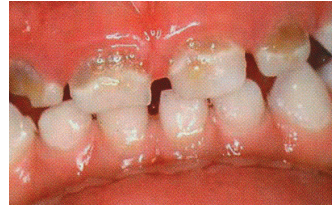
Los dientes parecen estar derritiéndose o astillándose.