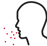
Mpox에 걸린 사람의 호흡기 비말이나 침을 통해